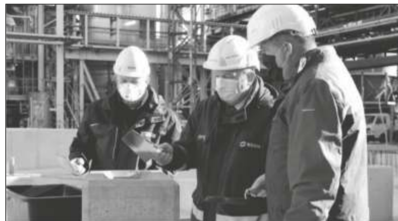
Uroczysty moment wmurowania kamienia węgielnego.