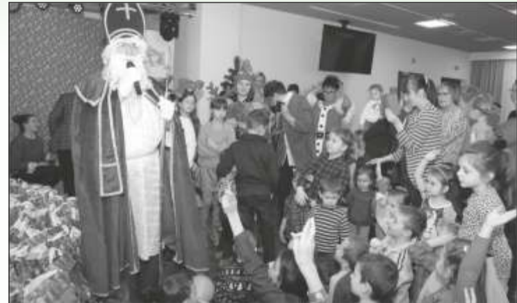
Tak w roku ubiegłym dzieci cieszyły się ze spotkania z Mikołajem.

Gratulujemy pomysłów i utrzymania tradycji pomimo trudnej sytuacji. Niech zadowolenie i roześmiane twarze dzieci będą najcenniejszą nagrodą za trud dla organizatorów tych spotkań. (P)