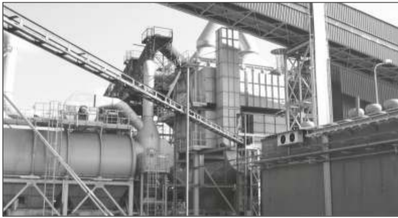
Spółka AMK Kraków wykonała w formule pod klucz modernizację Wydziału Huty Tlenku Cynku dla ZGH „Bolesław” S.A.

- Jest to jeden z elementów programu BATAS, w którym dostosowujemy nasze instalacje do wymogów środowiskowych. To przełomowa inwestycja, nie tylko w Hucie w Legnicy, ale w całym KGHM – dodał wiceprezes.