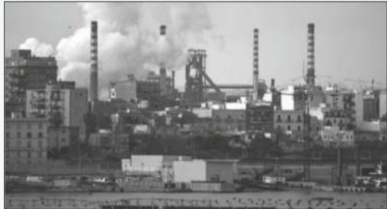
Włoski rząd robi wszystko by ArcelorMittal został w Ilvie. Czy największa europejska huta stanie się ekologicznym zakładem?

Według związków zawodowych działających w Ilvie koncern był gotów przekazać 4 grudnia 2019 roku zakład w Tarencie komisarzom wyznaczonym przez państwo i przystąpić do wygaszania wielkich pieców i zatrzymania linii produkcyjnych. Po tych zapowiedziach doszło do spotkania pomiędzy premierem Włoch Giuseppe Conte, a właścicielem Lakshmi Mittalem i jego synem Adityą, który jest dyrektorem finansowym ArcelorMittal.